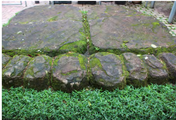
Steinerne „Füße“ des Buddha begrüßen Besucher direkt am Eingang des Japanischen Gartens in Kaiserslautern. (linkes Bild)