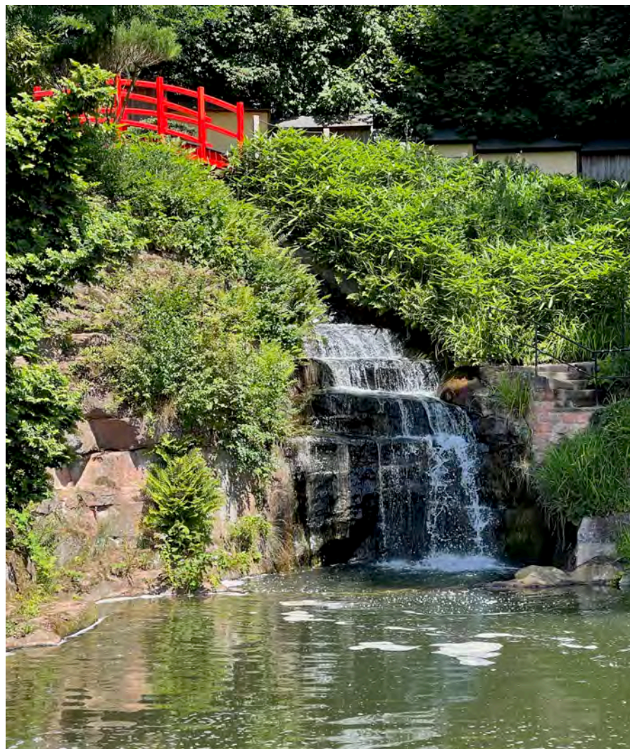
Mit der Farbe Rot sind in der japanischen Kultur positive Assoziationen verknüpft.

den dahinter liegenden Hang, offenbart sich eine perfekte Komposition von Wasser, Felsen, Bachläufen und Wegen. Alle diese Elemente wurden bei der Gestaltung bewusst um die bereits vorhandenen alten Gehölze herum angelegt, wodurch der Garten den Eindruck erweckt, als sei er seit jeher Teil dieser Landschaft.